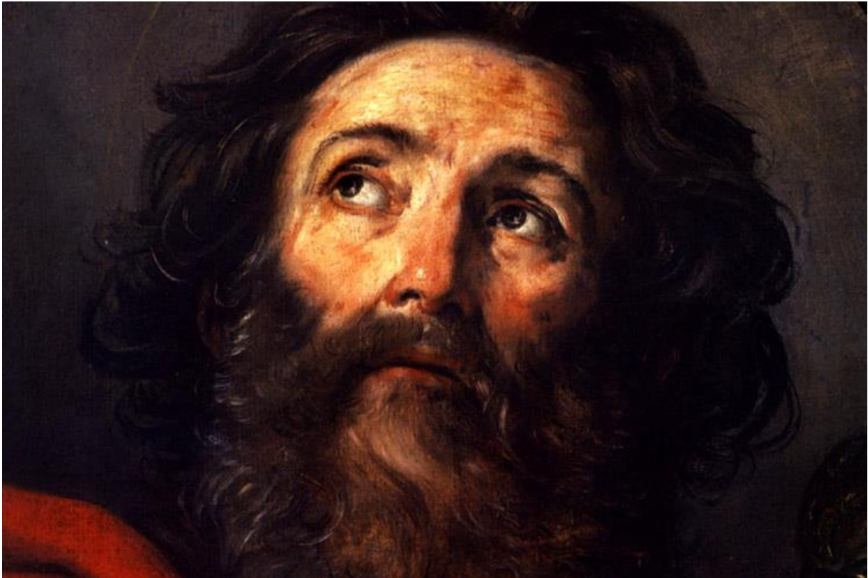
Paulus door Guido Reni (1575-1642), te zien in het Prado

Ook in de Bijbel gaat het vaak over gelijkheid. Paulus was een radicale gelijkheidsdenker. Zijn dopelingen waren niet langer Jood of Griek, slaaf of vrij, man of vrouw. Het was het antwoord op de onderdrukking door de Romeinen. Jezus' boodschap van sociale rechtvaardigheid viel in goede aarde. Dat hij aan het kruis stierf was zag Paulus als een vorm van onderdrukking. Op weg naar Damascus kwam hij tot het inzicht dat God juist daardoor liet weten de kant te kiezen van de "verworpenen der aarde".